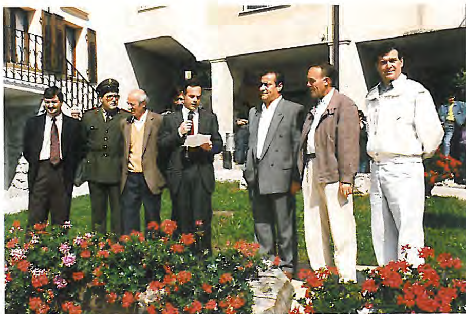
Incontro con Autorità di Bludenz e Vorarlberg.