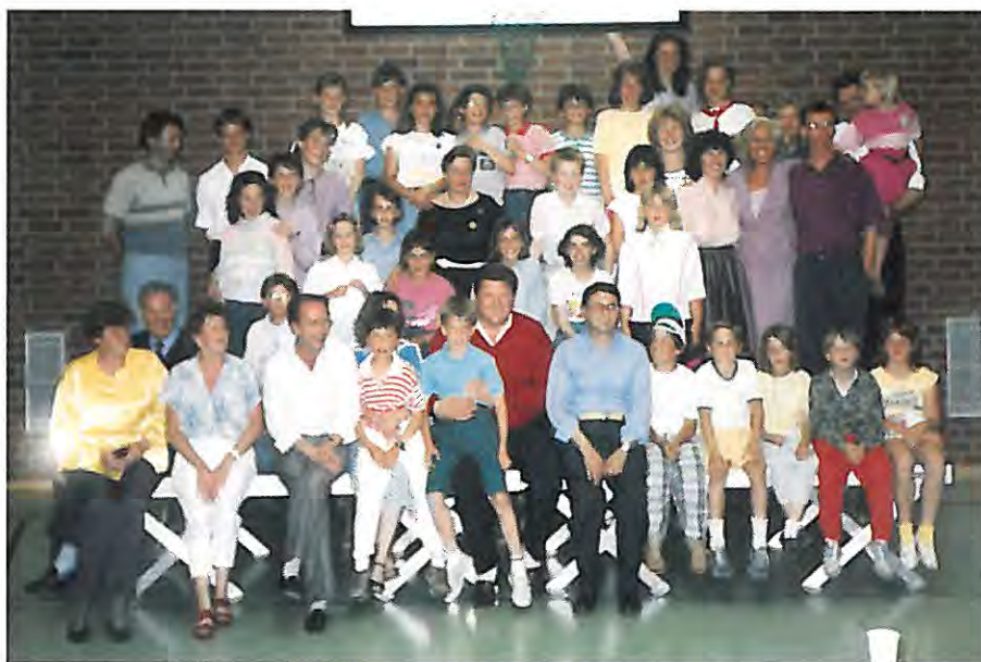
La 5 a Elementare con i coetanei di Kirchheim.

Ciò che forse è piaciuto di più ai bambini è stato quello che inizialmente più li spaventava: vivere nelle famiglie, nella realtà tedesca; al momento di ripartire tutti ponevano una domanda: "quando torniamo a Kirchheim?"; la speranza è che questo sia reso ancora possibile, ma soprattutto è giusto porre le basi per un ricambio, previsto per l'anno prossimo; l'inizio cioè di un interscambio scolastico che gioverà certamente agli alunni di Telve e Carzano, anche nello spirito di una Europa unita, ormai prossima.