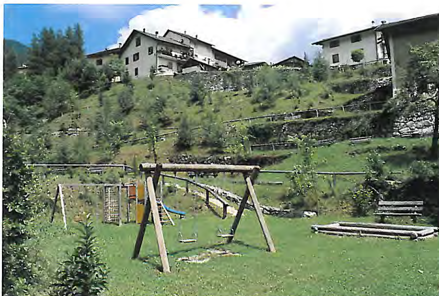
Il parco giochi loc. "Zegiate".