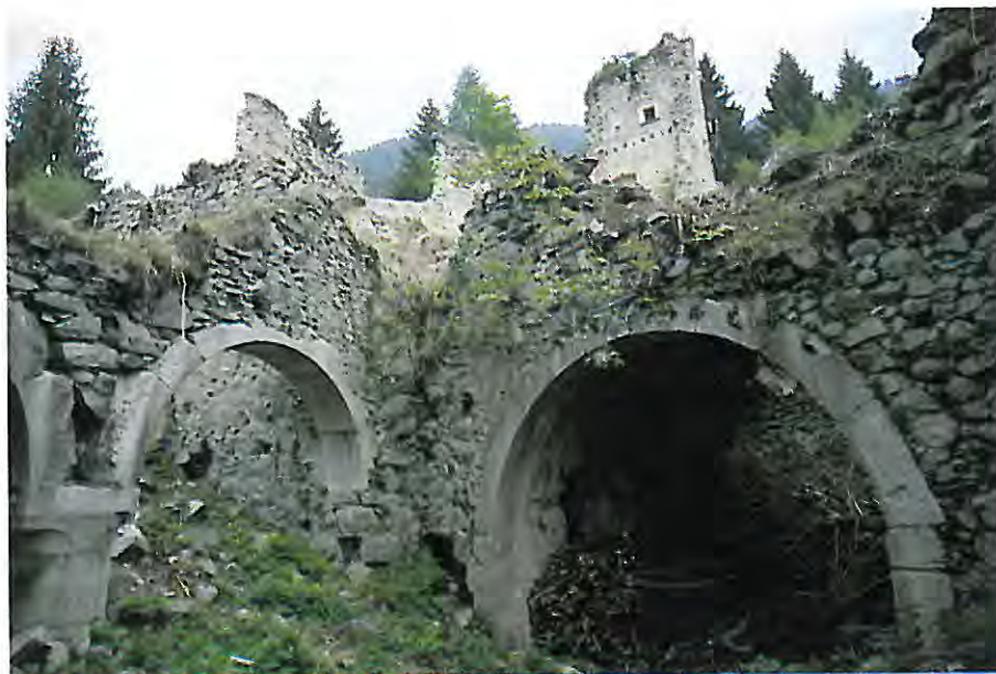
Ruderi interni di Castellalto.

L'incarico di progettare il restauro dell'antica chiesa è stato affidato all'arch. Carlo Sevegna. Sono ancora in corso le pratiche per la acquisizione al patrimonio comunale di questo interessante edificio di culto.