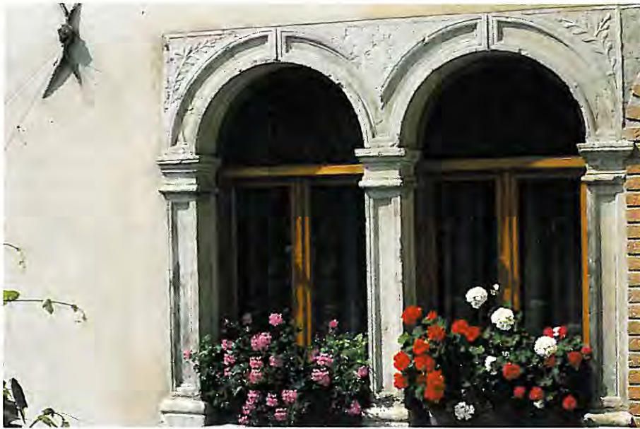
Bifora "Casa Moser" in via Fortuna.

Per anni le nostre popolazioni e le Amministrazioni via via succedutesi hanno avuto cura di usare il territorio con criteri razionali, nell'intento di salvaguardare per un "domani" risorse e paesaggio.