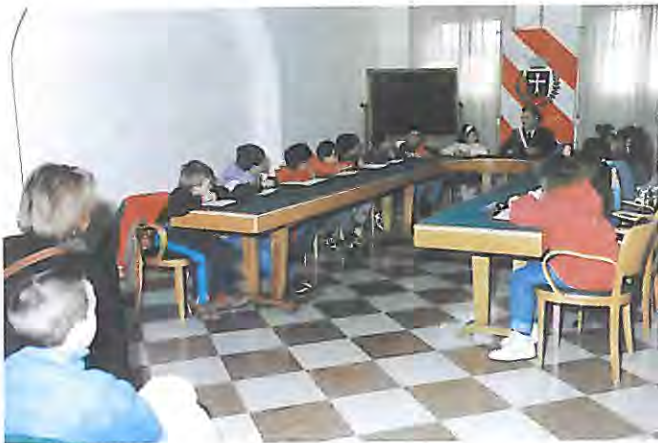
Incontro del Sindaco con la classe IV elementare di Telve

manufatto, simbolo non solo di un teatro di retrovia della prima guerra mondiale, ma significato anche del contributo alla promozione della cultura della montagna; l'auspicio richiamato è che detta struttura resti ben conservata, a lungo, per la memoria delle future generazioni, per il rispetto dei luoghi, per il conforto degli escursionisti, della brava gente. Nell'autunno imminente verrà convocata l'Assemblea Generale dei soci per la elezione - biennale - dei nuovi capogruppo e direzione, con la conseguente predisposizione del nuovo programma di lavoro.