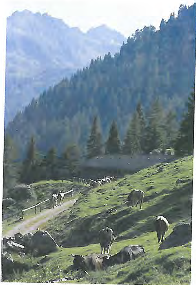
Valsolero di sopra

Incontrammo solamente un giovane escursionista solitario che dopo il saluto reciproco si allontanò verso Valsolero. Al Bivacco dell'ANA di Telve sul registro dei viandanti leggemo: «Solo il vento è sincero». Forse un deluso amareggiato aveva scritto questa frase e allora, per rallegrare altri passanti, aggiungemmo sotto: «Ma va! E' sincera anche la montagna, è sincera l'amicizia, è sincero il vino, l'amore ...».