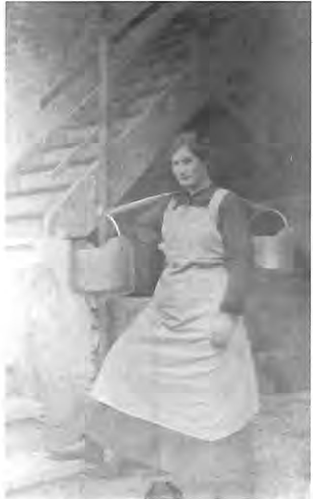
Fotografia rinvenuta presso il Kriegsarchiv di Vienna raffigurante una sconosciuta telvata. (Qualcuno può identificarla?)

A capo dell'amministrazione comunitaria erano eletti uno più " regolani " (detti anche consoli, maggiori o massari ); duravano in carica per un solo anno (non erano in genere rieleggibili per tre o più anni) ed erano la massima autorità espressa dall'assemblea. In diversi casi, specialmente nei centri più piccoli, le designazioni venivano effettuate a turno fra tutti i