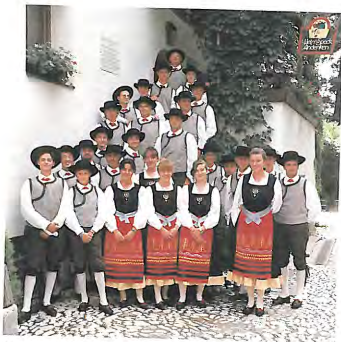
Un gruppo di bandisti in un momento di relax durante la trasferta a Merano.

L'attività bandistica coinvolge ormai una ottantina di persone tra suonatori effettivi e partecipanti ai corsi. In settembre ci attende inoltre un appuntamento importante che vedrà la banda impegnata per tre giorni a Ingolstat (Germania) alla 20 a "Festa d'autunno" in rappresentanza della Provincia Autonoma di Trento. Dal mese di agosto le prove si svolgono presso la nuova