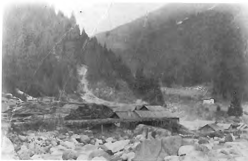
Le segherie di Pontarso ad inizio secolo.

In questo numero del notiziario comunale che, come di consueto, esce nel periodo estivo, diamo conto del risultato delle elezioni comunali, della formazione della nuova Giunta e del bilancio di previsione per il 1995. Viene inoltre esposta l'attività amministrativa dei primi mesi del 1995, con l'illustrazione delle principali deliberazioni del Consiglio e della Giunta comunali.