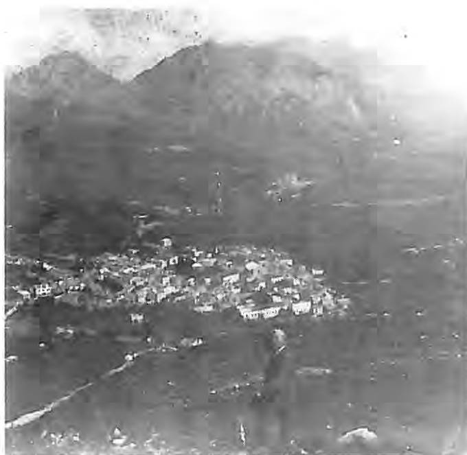
Telve - Il paese nell'immediato dopoguerra 1914-18.