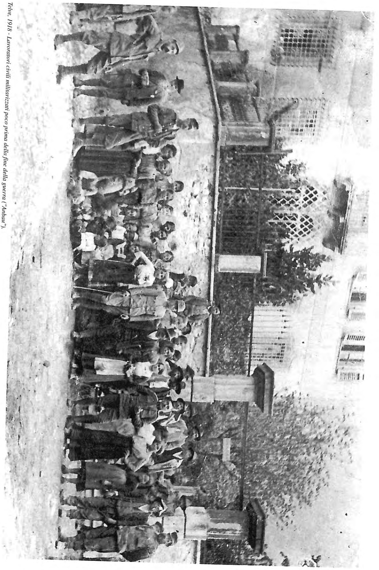
Telve, 1918 - Lavoratori civili militarizzati poco prima della fine della guerra ("Anbau").