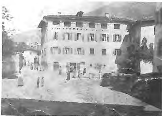
Telve - Piazza Vecchia, 1907.