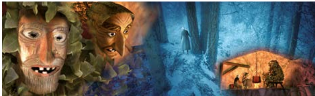
Illustrazione tratta dal libro con DVD-Video: "Leggende dell'UOMO SELVATICO" di Andrea Foches, edito da Museo degli Usi e Costumi della Gente Trentina e Priuli & Verlucca Editori, 2007