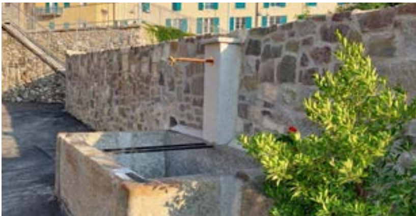
Recupero della vecchia fontana di via Facchinelli

Sempre a disposizione per tutti, adesso al lavoro!