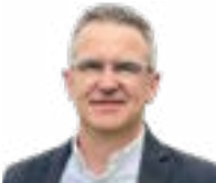
Sindaco DEGAUDENZ MATTEO