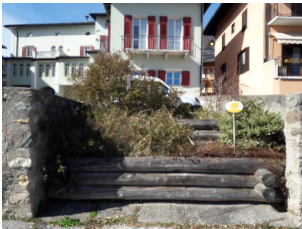
Aiuole piazzale F. Depero (corte interna Municipio/Biblioteca)