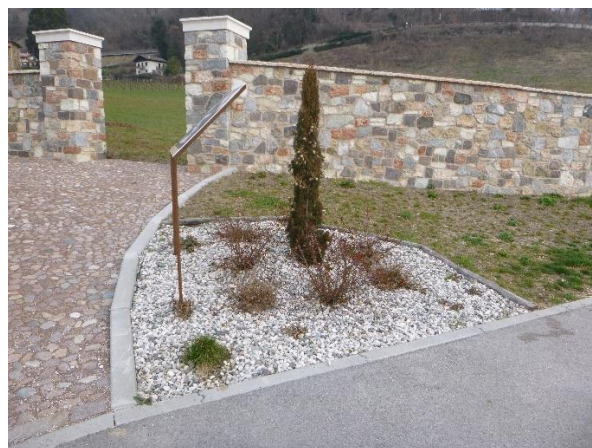
Aiuole e aree verdi in via S.Giustina/accesso parco villa D'Anna