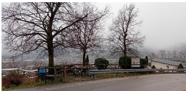
Aiuole e aree verdi in via S.Giustina/incrocio SP 31