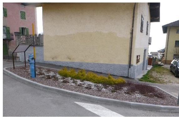
Aiuole via S.Giustina/bivio via Aurora