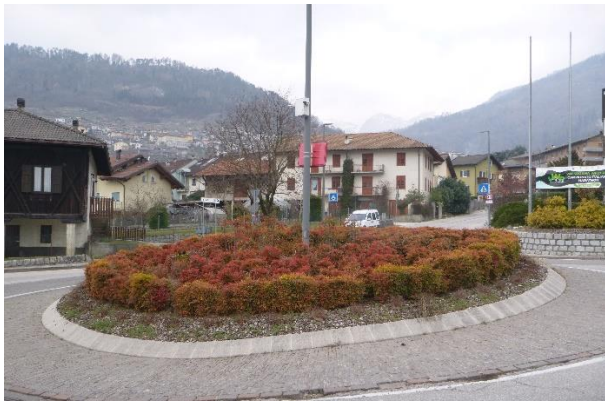
Aiuole rotatoria SP31/SP110