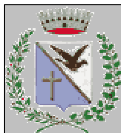
Comune di Telve di Sopra

CICLOAMATORI: Euro 30,00 CICLOTURISTI/ESCURSIONISTI: Euro 30,00 Da lunedì 22 al giorno della gara